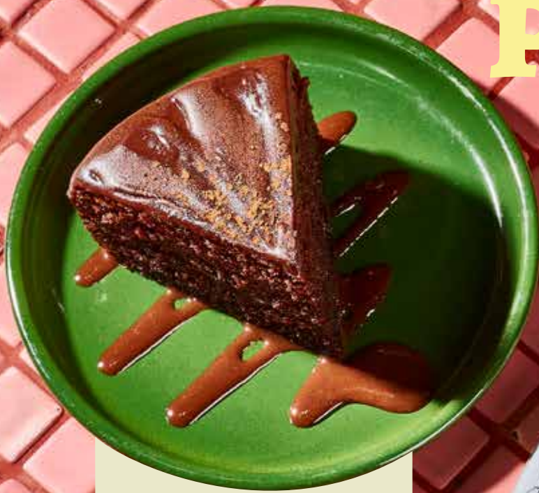
TORTA DE CHOCOLATE $15.800